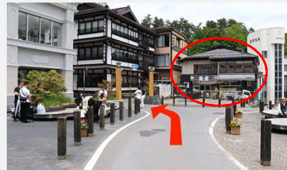
⑤ セブンイレブンを正面に手前の道を西の河原方面へ左折。