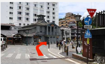
④ 暫く坂を下って行きますと観光名所の湯畑へ到着いたします。途中より一方通行なので時計回りに進みます。

【通行非推奨位置について】 グーグルマップでホテル一井までの道順を検索頂くと通行非推奨の道を案内されます。道幅が狭く、一方通行ではないため対向車も来ます。混雑状況により予定の時間より到着が遅れてしまう可能性もございますので、地図上のルートでお越し頂く事を推奨いたします。