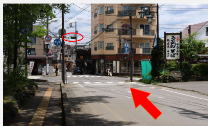
③ 道なりに坂を下って頂きバスターミナル前信号を直進、温泉街へ進みます。