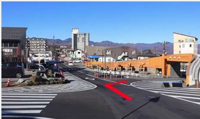
② 下りましたら、立体交差点を右斜めへ下り温泉門を通過します。