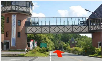
① 道の駅方面から温泉街方面へ道なりに坂を下ります。